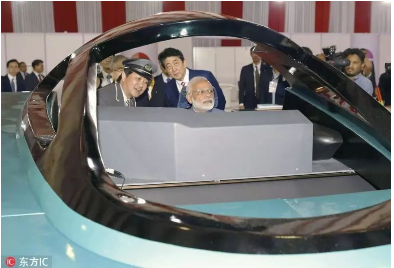
▲9月14日，莫迪和安倍晋三配合到场艾哈迈达巴德至孟买的高速铁路奠基仪式。图为莫迪、安倍亲自体验高铁模拟器。

东京赢得孟买-艾哈迈达巴德条约并不容易。条约划定，需要提供利率为0.1%、在50年内还清的120亿美元贷款，这占该项目预计成本的80%以上。日本还以慷慨的手艺援助和一揽子培训企图加以增补。