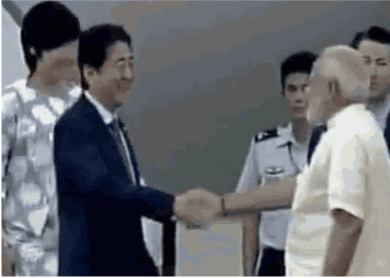
▲9月13日，日本首相安倍晋三到达印度总理莫迪的家乡艾哈迈达巴德，睁开为期3天的国是会见。安倍刚走下舷梯，莫迪的“熊抱”就扑面而来。

也许，在众人的想象中，没有哪个国家与子弹头列车的联系比日本更亲近。日本还一直在勉力出口其子弹头列车手艺。在与印度签约前，中国台湾地域是日本唯一乐成签约的客户。