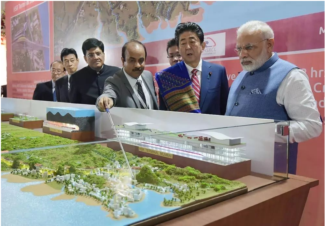
▲9月14日，莫迪和安倍听取有关高铁的情形先容。

另有，中国仍希望在印度企图修建1万公里高速铁路这块大蛋糕中分到一份。不久前，中国具有竞争力的报价以及关于快速施工的答应也许曾令印度倾向于在一些高速项目上与之互助。